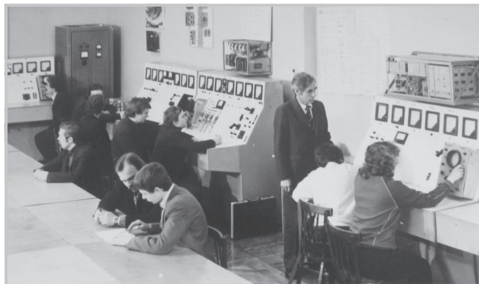
Лаборатория электрического привода кафедры ЭПА

зал пути решения, могли бы получить патенты на изобретения на разработанные устройства. Одно из них – устройство для запуска приводного асинхронного трехфазного короткозамкнутого двигателя станка-качалки для подъема нефти с использованием пружинной муфты особой конструкции, обеспечивающее снижение в 1,5-2,0 раза типа-габарита электрического двигателя, а второе – система пуска синхронного электродвигателя поршневого компрессора при прямом подключении обмотки возбуждения ротора к источнику постоянного тока.